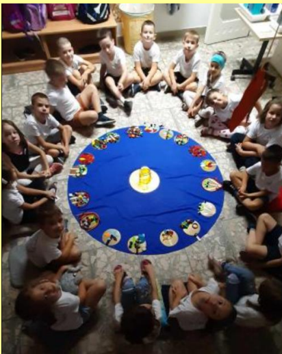
Csendesnap a Pávásban