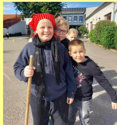
és a Deákon