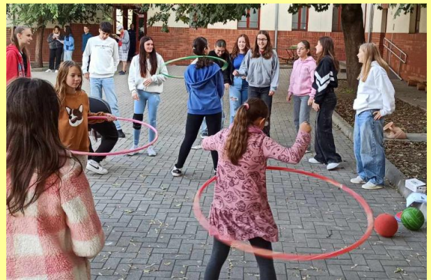
Magyar diáksport napja