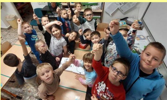
Népmese napja a Pávásban...