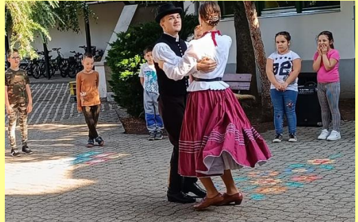
Az Árendás Néptáncgyűttes táncosai vendégeskedtek a Pávasházban.